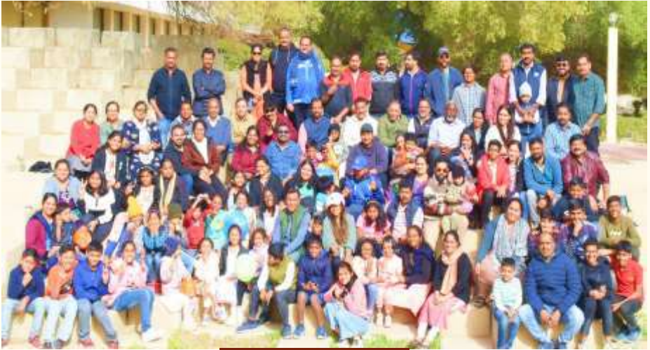
ANNUAL PICNIC 2025